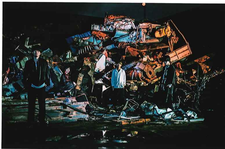
CRAZY VODKA TONIC