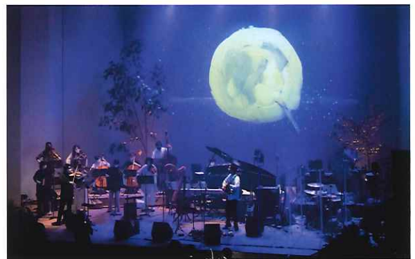
Feel Art Cafe