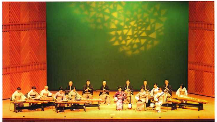
写真は前回開催のようす