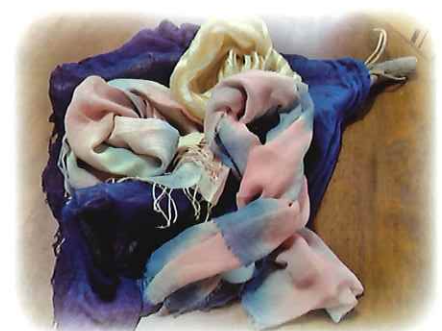
※写真はイメージです