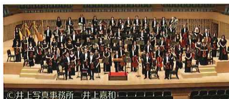
京都市交響楽団