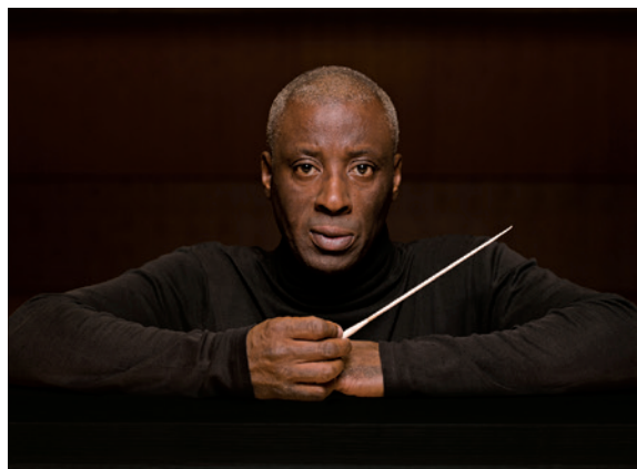
ウェイン・マーシャル